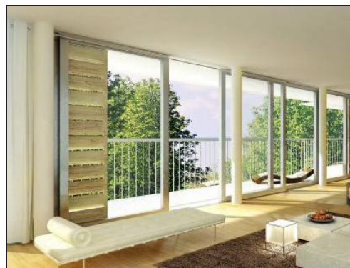
Confort. Tous les appartements sont traversants avec de larges baies vitrées qui apportent volume et luminosité.