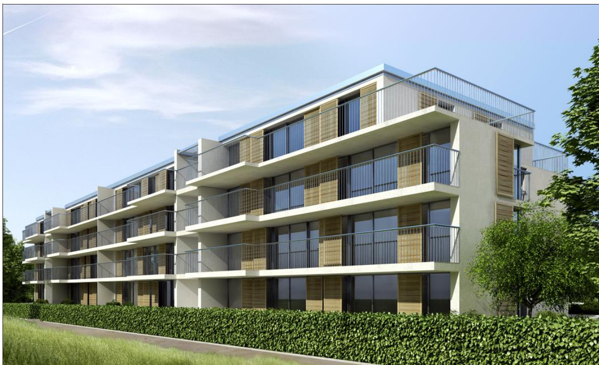
Les futurs Jardins de la Capite. Le site sera construit à Cologny, à quelques minutes de Vézenaz, du lac et du centre-ville, dans un environnement calme et sécurisé. (DR)

Les appartements sont traversants. Ils bénéficient de larges baies vitrées. Ils disposent tous d'une cave et d'un double-box avec porte télécommandée. Ceux situés en rez sont dotés d'un jardin privatif, ceux en étage d'un balcon spacieux, et ceux en attique